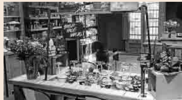
La tienda de jabones Lush está en Rambla Catalunya, 52.

una superficie de 140 metros cuadrados, es la primera tienda de Lush a pie de calle en la capital catalana. La compañía británica cuenta con otras tres tiendas en Barcelona y en L'Hospitalet, en el interior de L'illa Diagonal, Gran Vía 2 y Las Arenas. La apertura del nuevo local coincide con el 20 aniversario de Lush, que tiene su sede en el municipio de Poole, en Inglaterra.