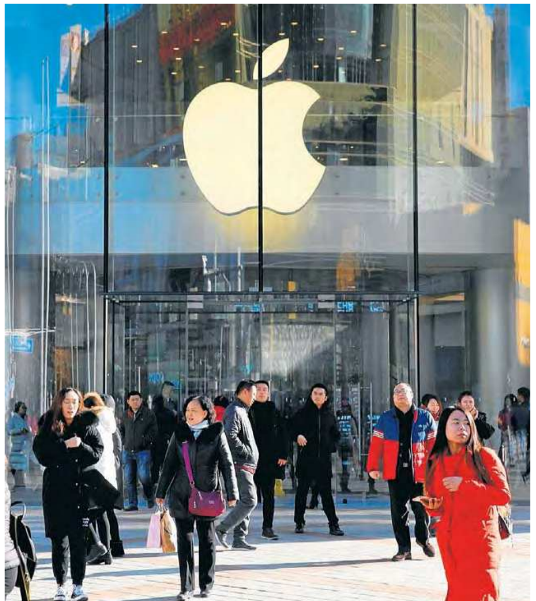
Fotografia d'una botiga Apple a Pequín. La companyia té una cinquena part del seu mercat a la Xina.

L'alentiment de la demanda dels consumidors també podria estar accelerant les tendències en la indústria dels smartphones, que Apple domina des de fa una dècada.